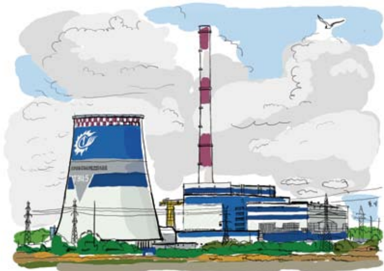
Правобережная ТЭЦ-5. Санкт-Петербург