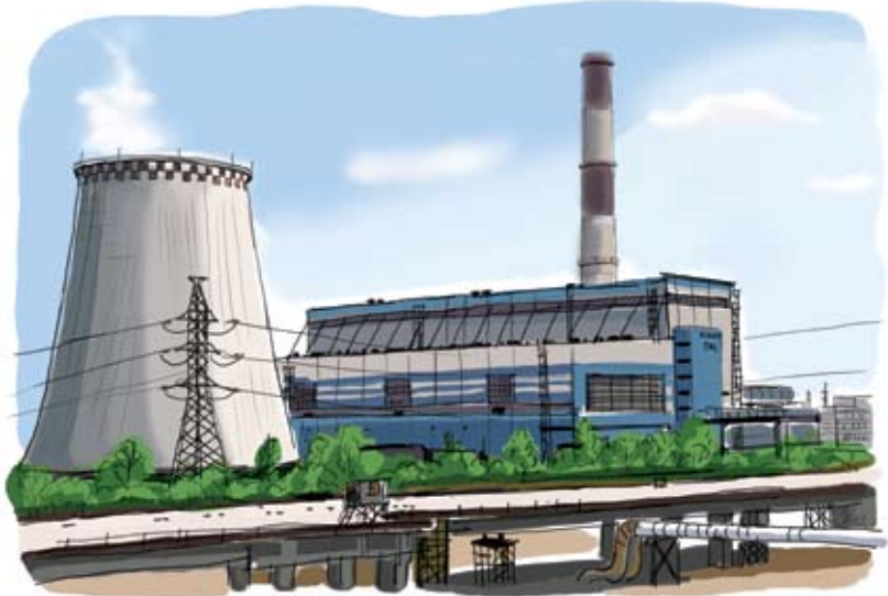
Южная ТЭЦ-22. Санкт-Петербург