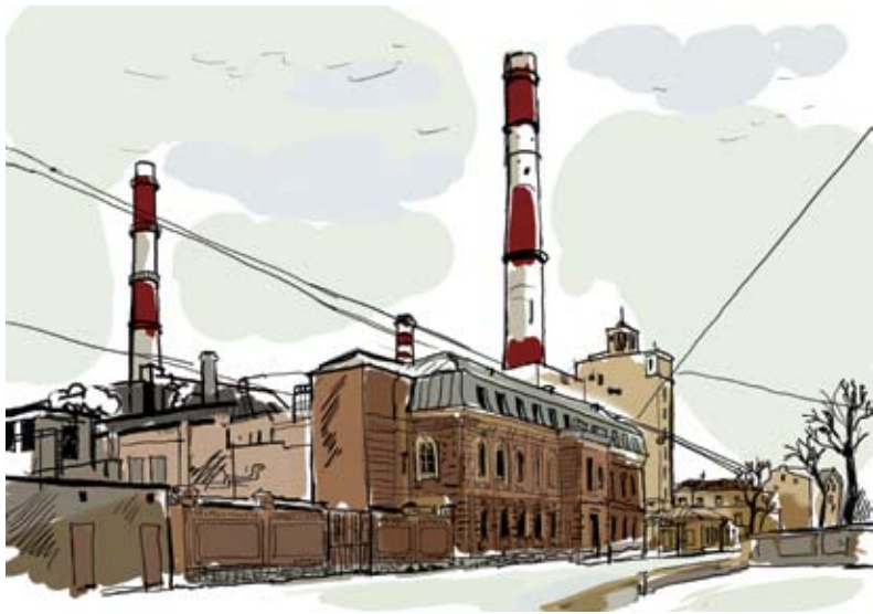
Центральная ТЭЦ, Санкт-Петербург