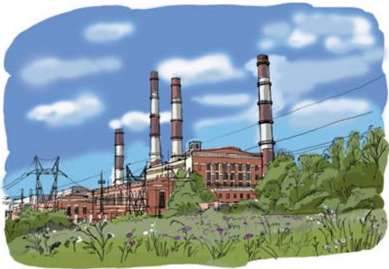
Автовская ТЭЦ-15. Санкт-Петербург