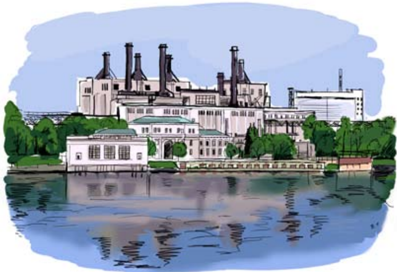
Дубровская ТЭЦ-8. Ленинградская область