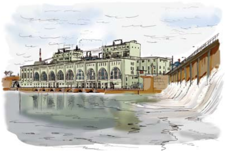
Волховская ГЭС-6. Ленинградская область