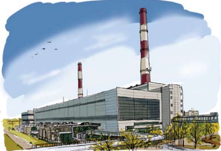
Северная ТЭЦ-21. Санкт-Петербург