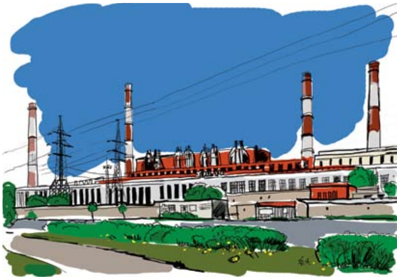
Первомайская ТЭС-14. Санкт-Петербург