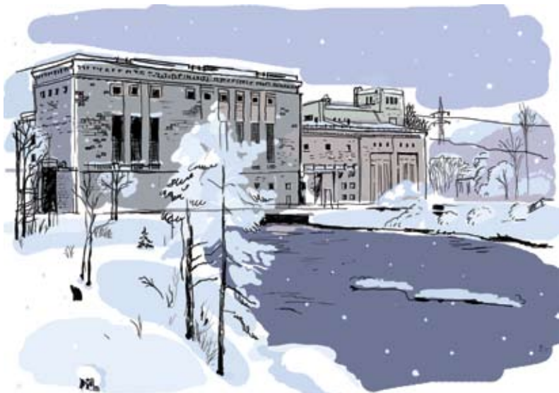
Кондопожская ГЭС-1. Республика Карелия